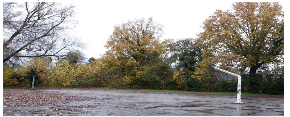
Baskets bij het Buut

Aan het Buut grenst een basketbalveld (aan vervanging toe) en een groot grasveld. Deze beide ruimtes lenen zich bij uitstek